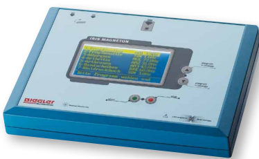
Großes Display für komfortable und sichere Anwendung

Auf Grund der Basiserfolge wurde von Biegler Medizintechnik und Medical Electronics das Magnetfeldprojekt IRIS Magneton gestartet. IRIS Magneton eignet sich auf Grund des modularen Aufbaus und der fortschrittlichen Systemarchitektur für vielseitige Anwendungen im Rahmen einer Magnetfeldanwendung.