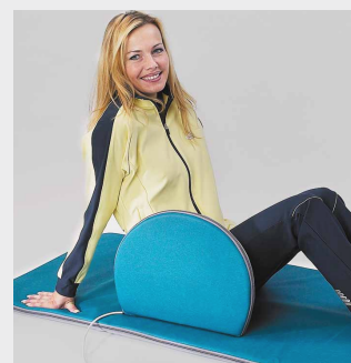
Kissen und Matte